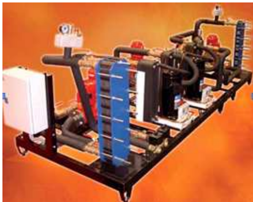
Exemple de réalisation possible

Dans le cadre du projet PREMIO, GIORDANO Industries propose d'adapter cette gamme de produits pour que ces systèmes puissent être pilotés par des commandes extérieures. Il s'agira de permettre une commande de délestage par une consigne délivrée par la centrale de pilotage PREMIO. Ce projet a pour but de lisser la courbe de consommation d'électricité, en recherchant des applications généralisables.