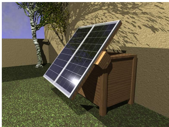
Présentation virtuelle du système MICROSCOPE